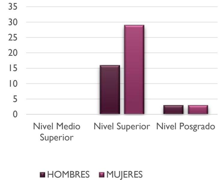
Beneficiarios por Nivel Educativo

El desglose contempla el total de solicitudes de Apoyos Económicos otorgadas por el Comité de Apoyos Económicos de la COFAA-IPN durante el periodo julio-septiembre 2024.